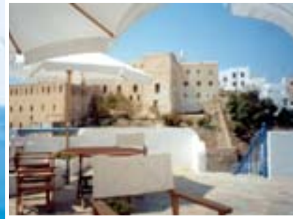
Das Kastell – Blick vom Dachgarten

Die Pension bietet Doppel- und Dreierzimmer sowie Studios mit kleiner Küche. Alle Zimmer haben einen Balkon, ein eigenes Bad und Zentralheizung. Die Terrasse und der Dachgarten laden zum Frühstück und zur abendlichen Weinrunde ein.