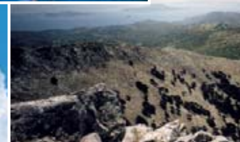
Blick vom Zas

Der höchste Berg von Naxos und den Kykladen überhaupt ist der Berg Zeus (Zas) mit einer Höhe von 1004 m.