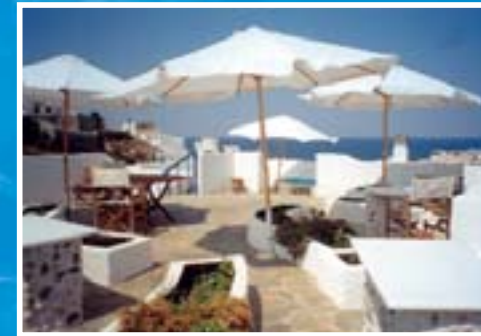
Dachgarten mit Seeblick